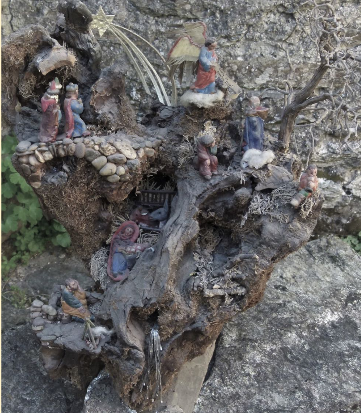
La crèche familiale à La Maurinié