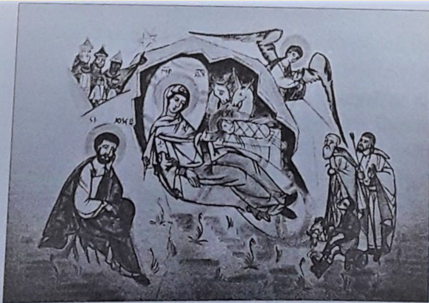
La nativeta. Fresco de Micoulau GRESCHNY (santuàri de la Tourre-Santo, Marsiho).